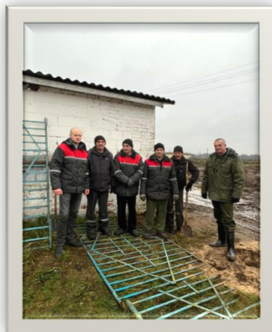
Наведение порядка на территории ОАО «Немки»

Порядок на территориях сельхозорганизаций – это не просто внешний облик, а отражение культуры производства и уважительного отношения к труду.