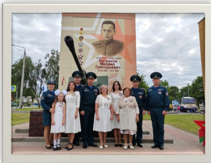
Открытие мурала Герою Советского Союза М.Г.Батракову в г.Ветке

Развитие инфраструктуры водоснабжения, замена устаревших труб, использование современных технологий фильтрации и очистки воды, создание эффективной системы очистных сооружений – все эти задачи решаются. Например, в 2025 году после реконструкции состоялось открытие котельной в урочище Шубино